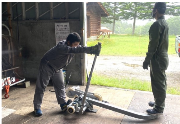
白樺トリプルリフト握索機分解点検整備