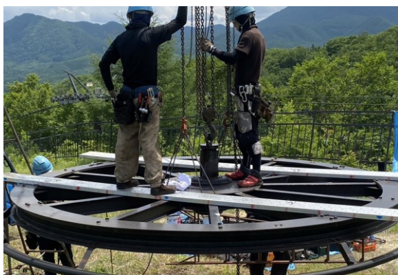
中央ペアリフト終点滑車オイルシール交換