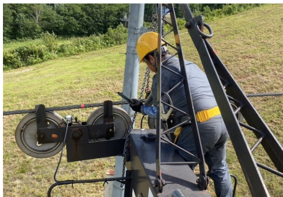
中央ペアリフト索輪点検及びグリスアップ